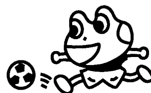
指をそろえて出すとてのひらにのる