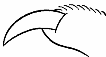
ちょうどよいつめ