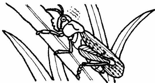
ススキの葉を食べるトノサマバッタ

バッタを飼うときは、つかまえてきた所の草を、えさ用にとってきて、水を入れた小びんにさし、飼育ケースに入れてやります。それといっしょに、水分とミネラルをおぎなうため、キュウリやリンゴの切ったものも、入れてやりましょう。（監修・中山 周平）