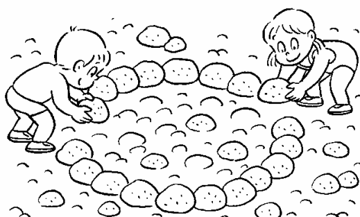
池をつくる所の石を、周りに積む