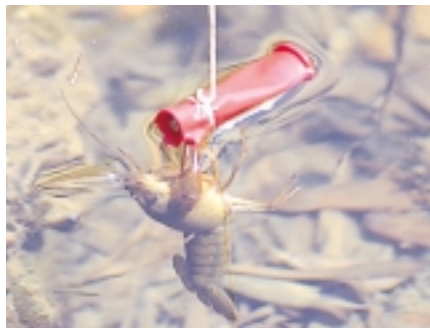
ふうせん 風船の切れはし