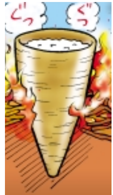
土器を地面につきさし、まわりで火をおこした。