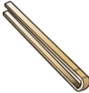
ピンセット型のはし

なら 奈良時代より前は、ピンセットのように一本につながっているはしが使われていたようだ。くちばしのような形なので、そこから「はし」という名前になったという説もある。